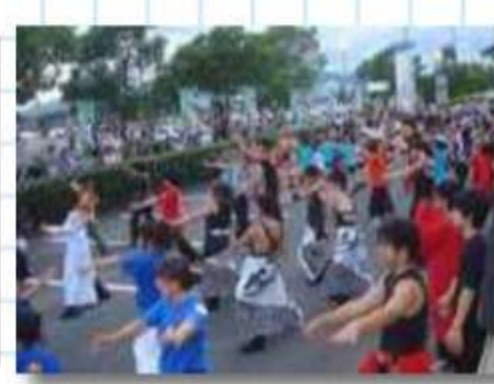
大きな呼び物の総踊り