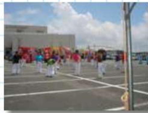
豊橋舞花連は、新衣 装。昨年とガラッとイ メージチェンジ