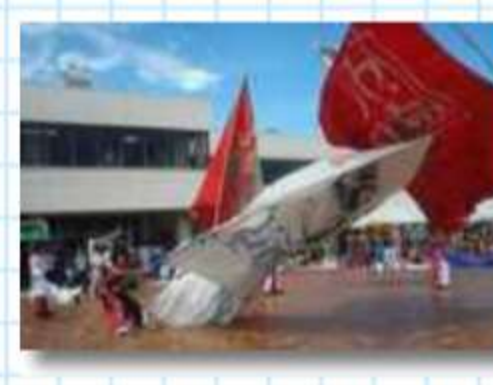
大フラッグの豪快な神陽～Sin ～