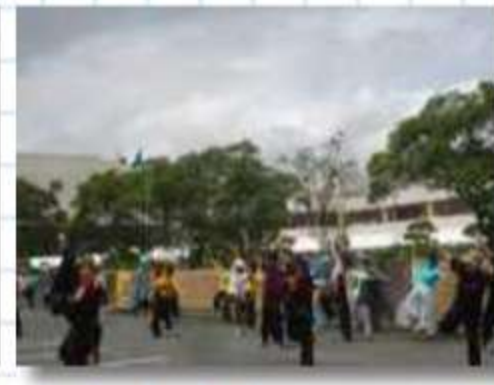
レクチャー黒田武士を 担当の宴屋（名古屋）