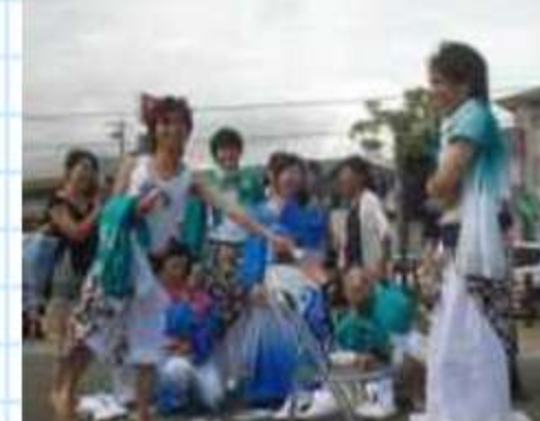
アトラクションも楽しむ初出 場「守破離(名古屋)」