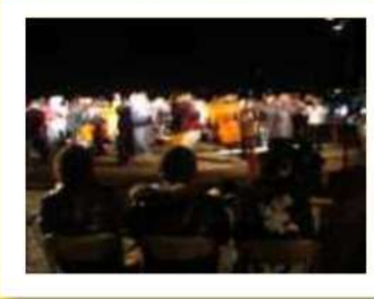
つながりを大切にする踊り子達の祭 典