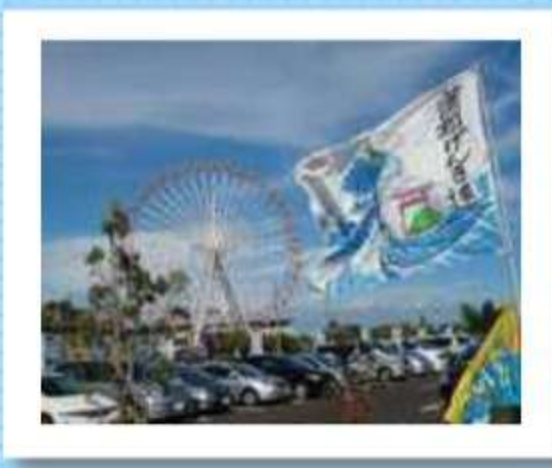
呼び込みに目印のげんき連フラッグ