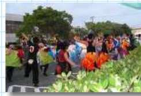
チーム入り乱れて交流の総踊り