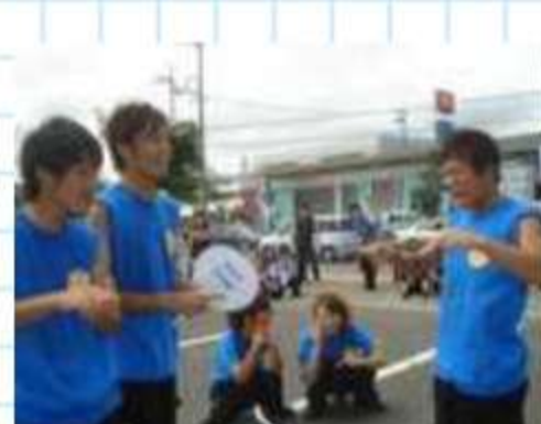
がんばれ！チームメイ トの応援