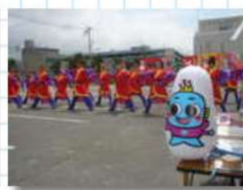
初出場チーム元∞G E N∞（知多市）