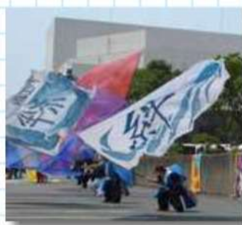
力が入ったフラッグ演舞