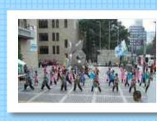
市役所前で笑顔炸裂