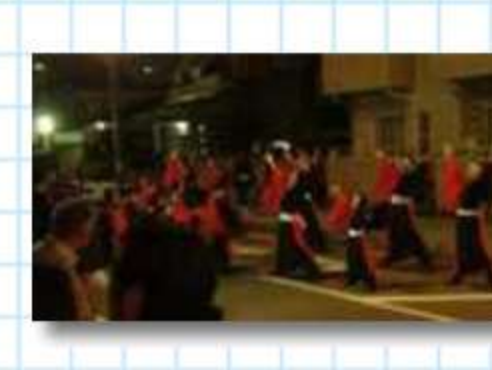
小さな踊り子さんも力が入っていて素晴らしかった悠紀