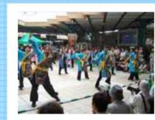
元気いっぱい、それっ！