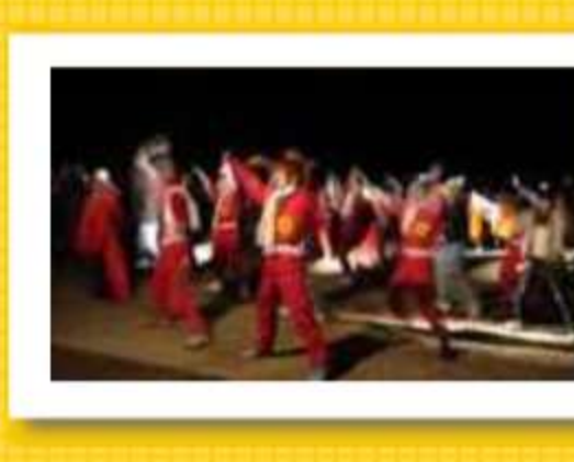
楽しいチームあり、実力派あり、さ まざまに