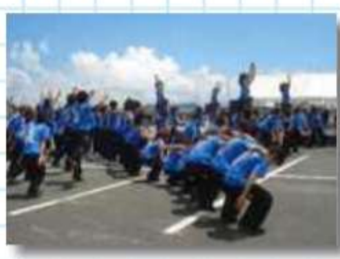
バックには三河大島。 海つながりのチームが 多い？