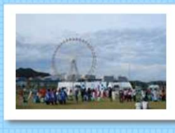
衣装の色もそれぞれでちゃんぷるりん