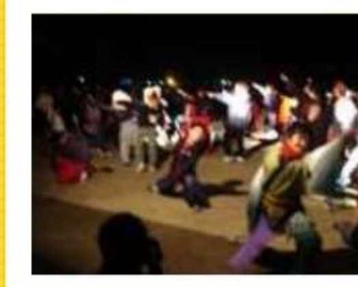
寒風に負けずに若いパワーで踊る