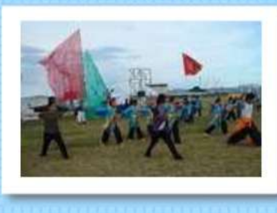
名古屋からも応援に