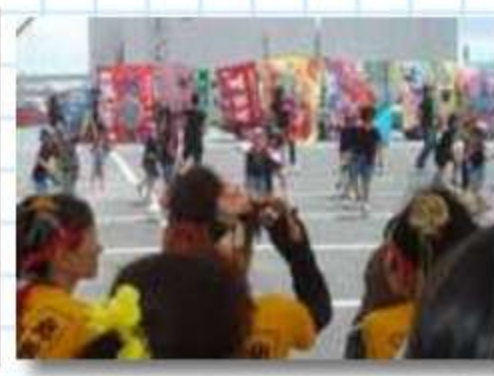
形北キッズの子どもた ち。お母さんも一緒 に。