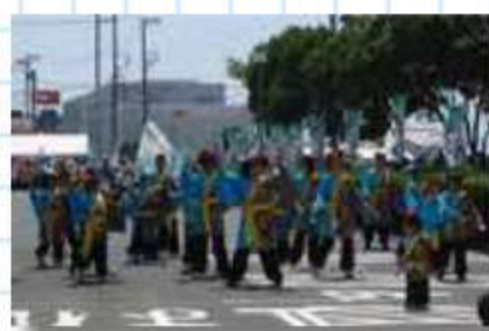
蒲郡げんき連ミニパレード会場