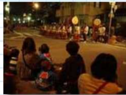
ストリート会場で日近 総踊り「うらじゃ音頭」 太鼓

伝統ある神社の夜祭に、岡崎市内チームに混ざって参加してきました。 会場は参道の交差点を中心に車両通行禁止の遊歩道にしてストリートの演舞ステージです。和太鼓や神輿の練りもあり、祭り気分上々。 参加チームは、六所連、輝葵踊、きらら岡崎、悠紀、きららえんくう、ささゆり額田、天乱踊舞、チーム日近、半田チーム踊りんGONほか和太鼓。 新曲の披露ということで緊張。さらに、若い他チームさんと演舞が重なったサプライズもありましたが、無事終了。MCに蒲郡の観光交流ウィークのPRもしましたよ。 やや時間が押しましたが、予定通りの総踊り曲もかかり、にこやかに踊ってきました。 夜店や帰りのお楽しみもあり、岡崎遠征は毎年心待ちしているお祭りですね。