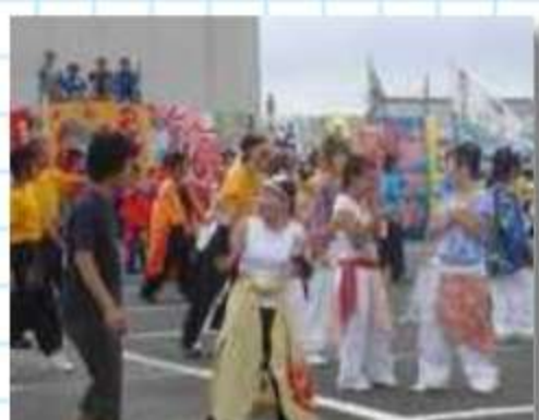
祭会場では笑顔がいつ ぱい