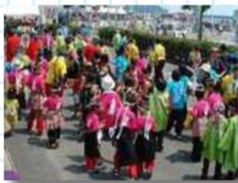
色鮮やかな衣装がにぎやか