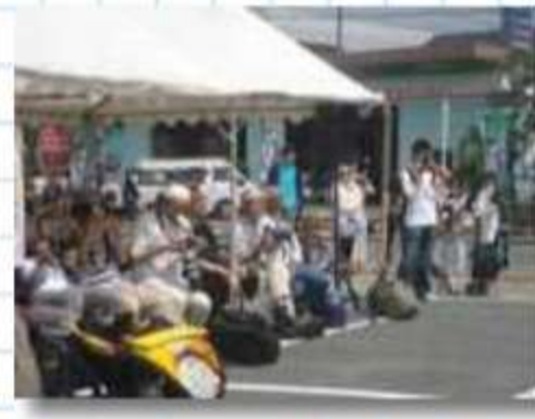
シャッターチャンス を待ち構えるカメラマン たちがずらりと並ぶ最 前列