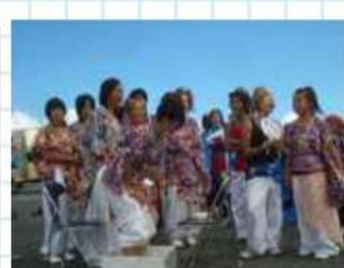
楽しいんだよ～。がま ん氷のはちきん（蒲 郡）