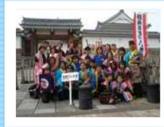
駿府城前でパチリ