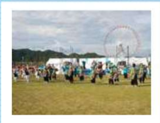
正面からステージを望む

直前の案内でしたが、この企画に、近隣から、あるいは、遠くからファミリーで、一人でフラッグを持って参加してくれました。