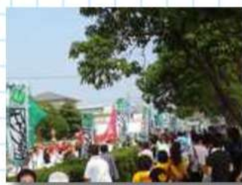
生垣をはさんで観客も楽しめるミニパレード総踊り