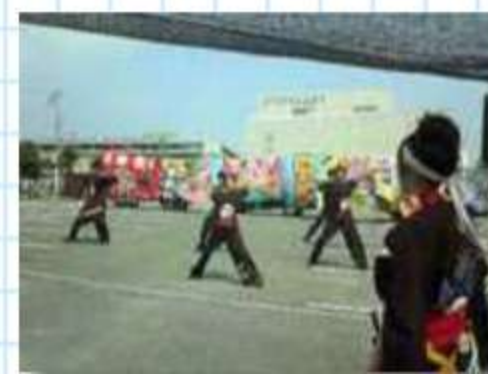
遠方と歌山から参加の「team雅龍」と演舞を見る名古屋の「宴屋」