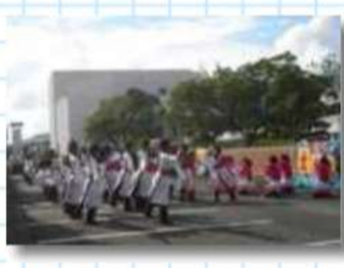
大漁旗の前で踊る夜宵 (名古屋)