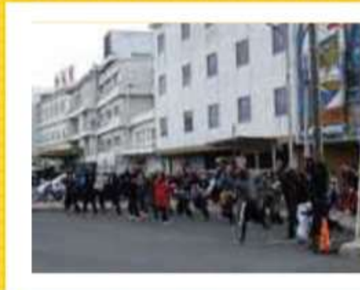
温泉バス停前でカウントダウンのサ プライズ企画