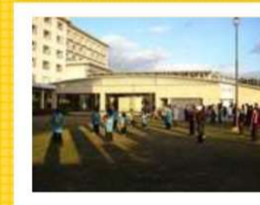
ホテル竹島でもアトラクション