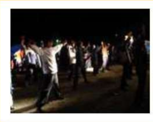
手作りの祭に大勢の踊り子が駆けつ ける

年をまたいで踊り明かそうと、カウ ントダウンを心待ちに訪れる踊り子達 は、近隣市町村ばかりか県外からも多 く、毎年600～800人も。