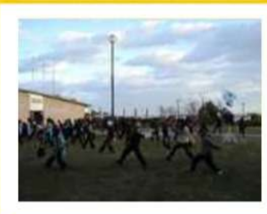
宿泊客も部屋の窓から手を振って声 援