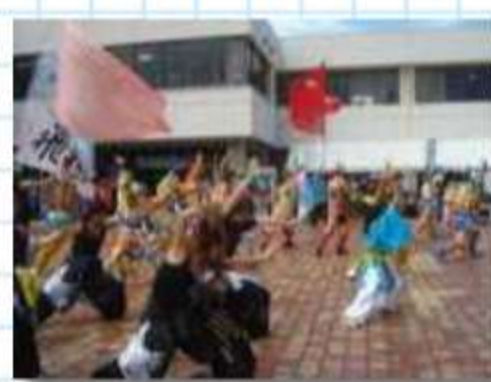
フラッグ前で踊る