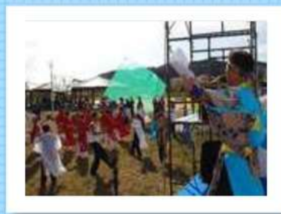
煽り役は、蒲郡げんき連のMC