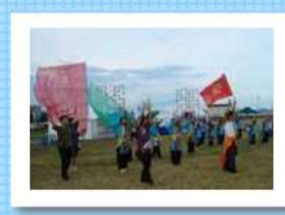
途中フラッグ企画も