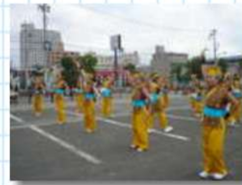
味噌とジャズの町・岡崎の輝 奏踊～KIKYOU～は、昭和の美女 軍団