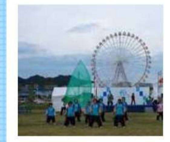
吉良夢うさぎチーム