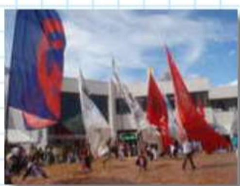
フラッグショーは壮観