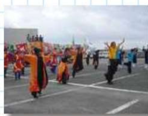
まずは総踊りから始ま ります。