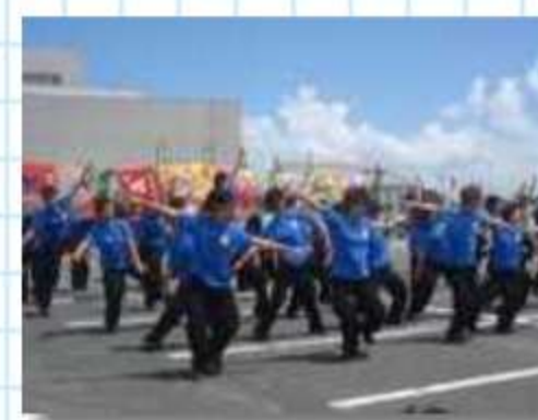
初出場・最多人数の日本福祉大 学夢人党