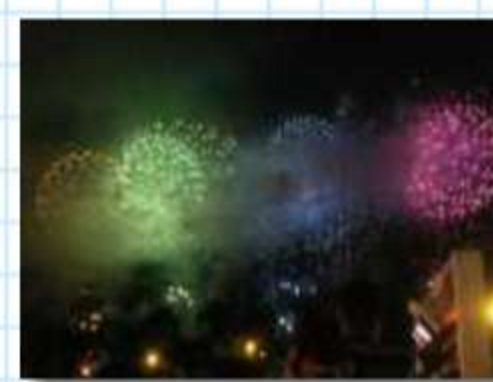
夜は華麗な大花火を楽しみま した。疲れも吹き飛ばす美しさ