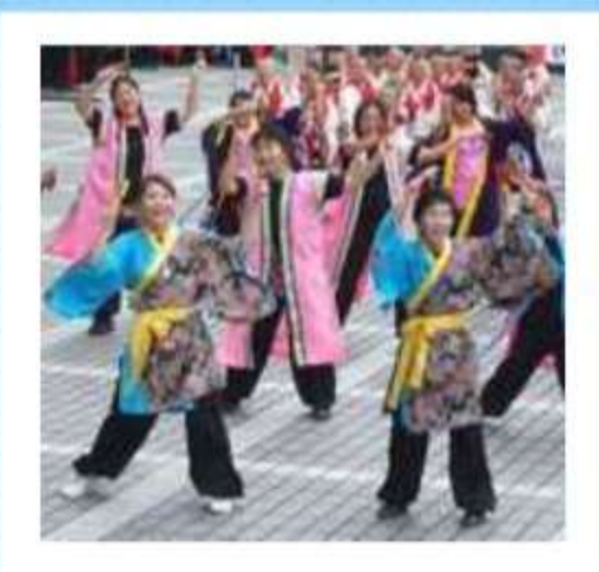
楽しいよさこいみんなで踊ろう