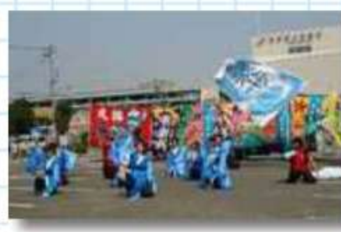
大量旗の前で西三河チーム「team絆」