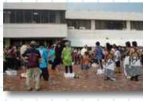
ひんやり氷を使ったゲームも楽しみ