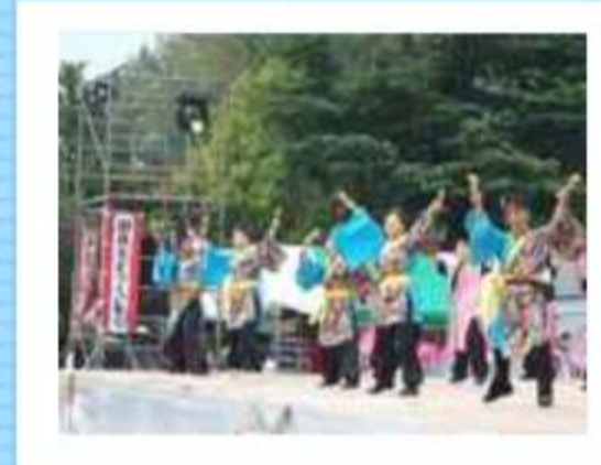
メイン駿府城公園の大舞台