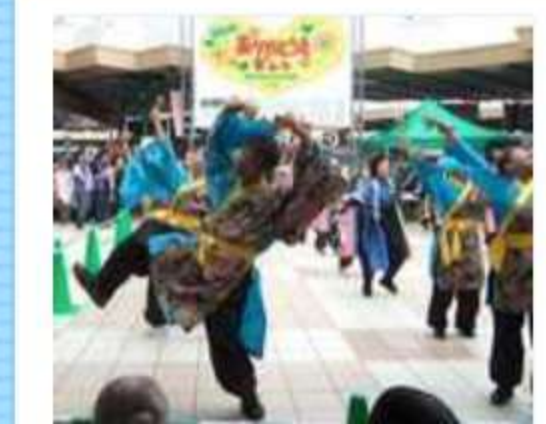
ほら、笑って、笑ってww