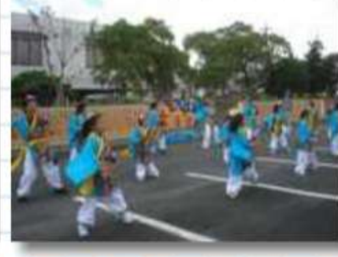
元気に声も出しなが ら