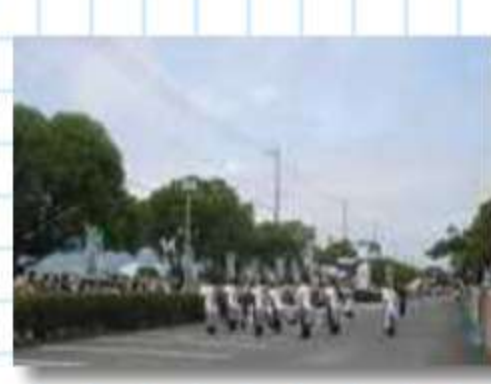
ミニバレー会場の更紗 奥にフラッグが見えま すか