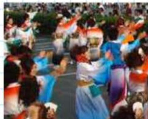
大編成の「夜宵」名古屋から新衣装で