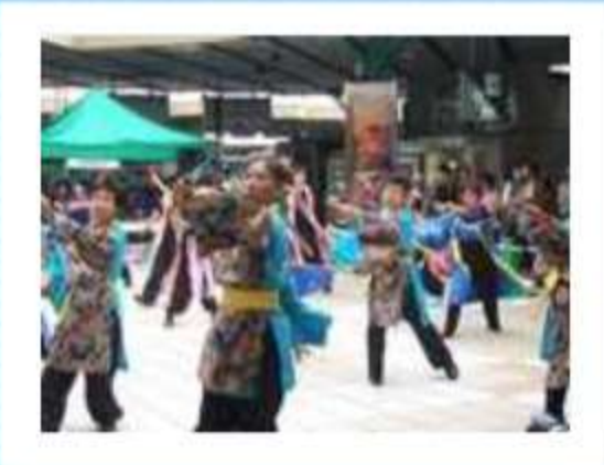
新静岡駅前広場にて最初の演舞