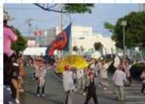
名古屋のチーム「今日一屋」