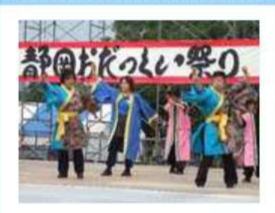
『若い！』ババパワーで