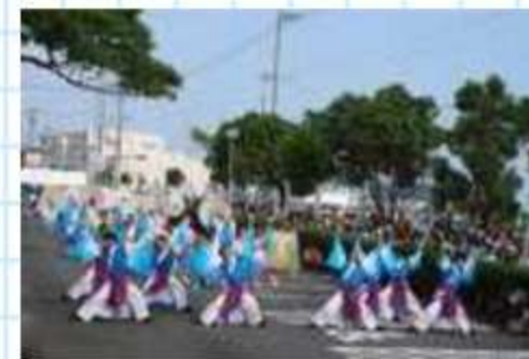
名古屋のチーム「gnome」今年の演舞初お披露目