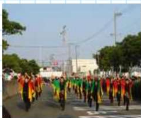
はんだ踊りんチーム GONパレード