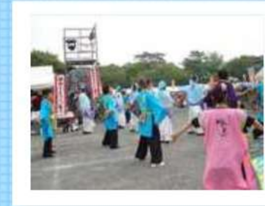
メイン会場で、総踊りのうなぎに乱入。演舞後は美味しい冷茶サービスです。