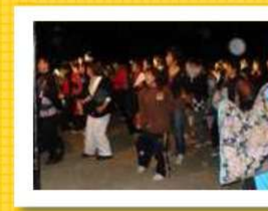
北は東北、関東、南は京都からも参 加者あり盛り上がる