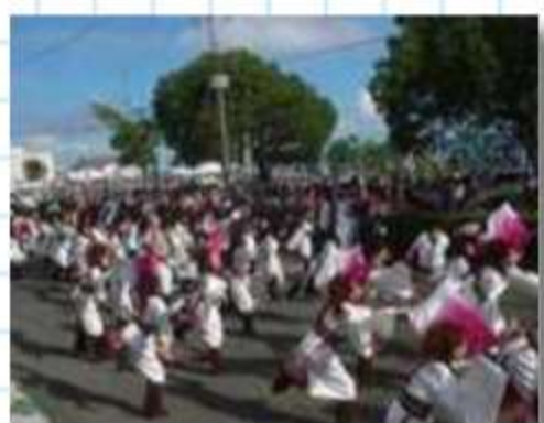
艶やかな華が会場いつ ぱいの夜宵