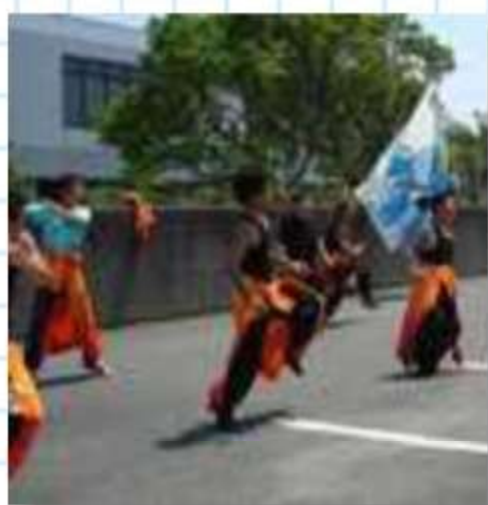
「遣舞神使」躍動感溢れる演舞