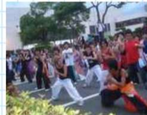
総踊りは、みんなで踊れるの が、楽しい