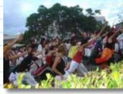
パワフルにジャンプ！