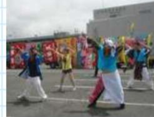
チームを超えて交流