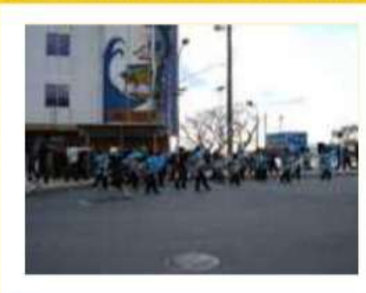
三谷観光協会の協力で、温泉客にア ピール

地域に貢献する蒲郡げんき連。 市民の手による観光交流事業として 温泉協会やホテル内で、観光客へもアピールしました。