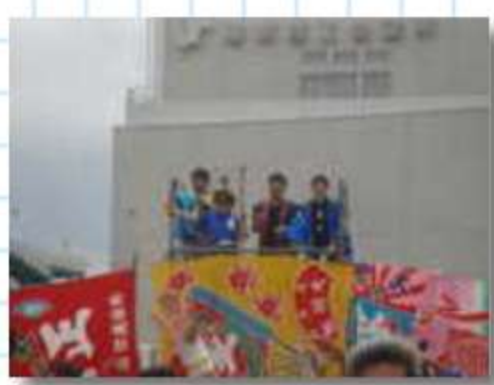
オープニング挨拶。ス タップチーム紹介

今年の特徴は、初出場チームが多く、そして、新曲・新衣装の初披露を蒲郡でと気合を入れてくるチームが目立ちました。総踊りの数々や、海辺の会場というロケーションの魅力に加え、夜の大花火も踊り子が魅力を感じて数ある祭からチョイスの条件になっているのでしょうか。チームエントリーはしていなくても、過去踊り子だったチームを離れた人も、なつかしい顔に会いたいと個人でもやってくる。そんな魅力のある蒲郡のげんき祭りです。海辺の町らしく、大漁旗を飾った仮設ステージ。そして、ご自慢のフラッグが乱立。踊り以外でも、魅せます。